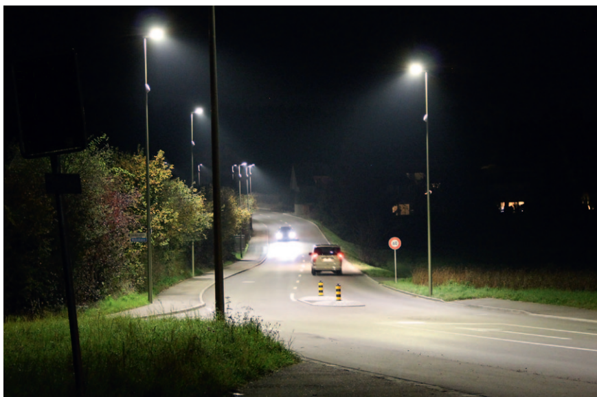
Bild 1 Anlage mit Radarsensoren und LED-Leuchten in Regensdorf.

Bei einer Steuerung werden zwar die Zustände von einer Zentrale aus «gesteuert», es erfolgt jedoch keine Rückmeldung an die Zentrale, die darauf reagieren könnte. Das Intelligente an den neuen Systemen ist also oft der Schritt von einer Steuerung zu einer Regelung. Sehr gut erfassen und regeln kann man