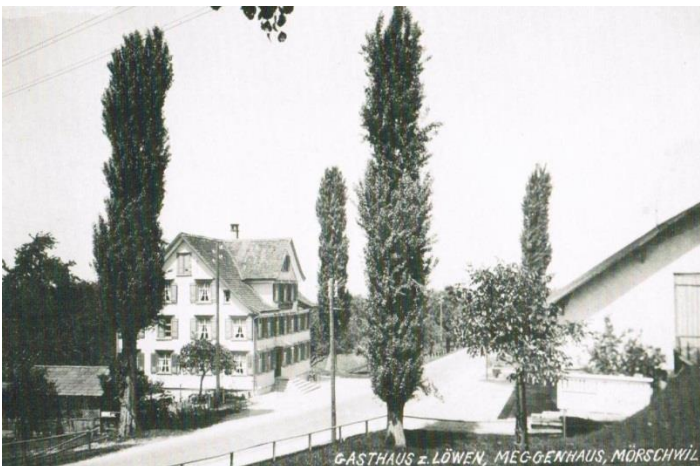
Das Gasthaus Löwen früher. Quelle: Würth, F. (1991). Mörschwil – Wie es noch ist – und wie es war.