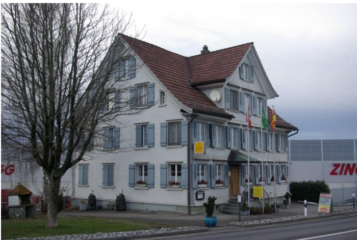
Das Restaurant Löwen heute.