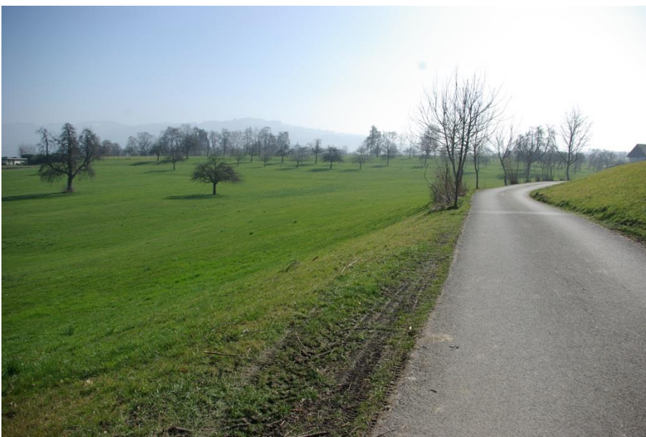
Das Gebiet links der Strasse nach Enggwil heisst immer noch Bummert, auch wenn kaum mehr Obstbäume stehen.