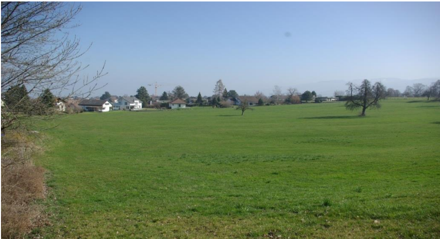
Im Vordergrund des Fotos befindet sich die Flur „Bummert“.