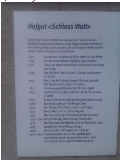
Geschichte des Hofgutes Watt (Tafel beim Schloss Watt).