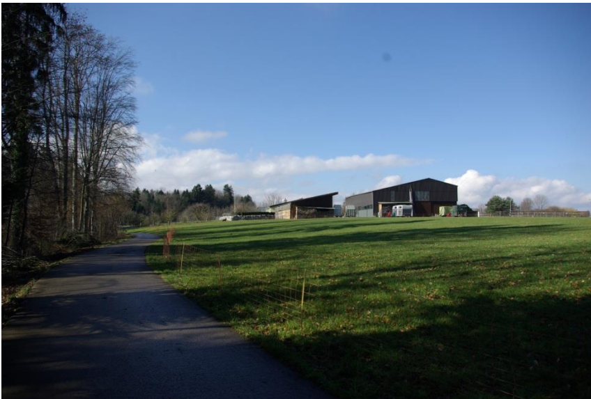
Das Gehöft Cholegrueben mit Umgebung.