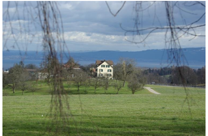
... und von Süden...