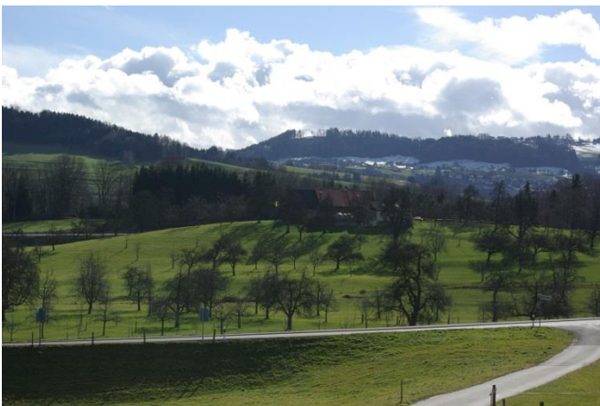
... sowie von Westen.