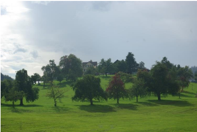
Die Schönau von Norden...