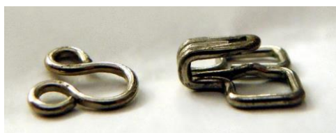
Abbildung: Häftli (Eitan Ferman. Hook and eye clasp. CC BY-SA 3.0.)

Der Name Hasenbach wurde früher für den Bachlauf im Abschnitt nach dem Zusammenfluss mit dem Chesselbach verwendet. Das Bestimmungswort Hase bezieht sich, falls keine Umdeutung aus Hasel vorliegt, sehr wahrscheinlich auf das Vorkommen des Feldhasen, der auch in unserer Region häufig anzutreffen war und gerne gejagt wurde. Hase geht zurück auf althochdeutsch has, haso, mittelhochdeutsch has, hase (vergleiche Nyffenegger & Graf, Band 2.2, 2007, S. 270). Für eine Erklärung des Hasenbachs vom Fischname Hasel, der im Dialekt verschiedenste Fischarten bezeichnen kann, fehlen Anhaltspunkte in den Quellendokumenten.