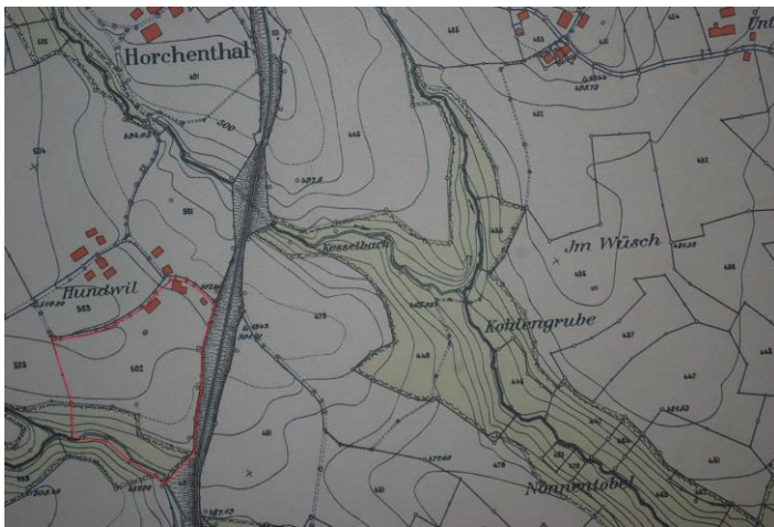
Ausschnitt aus dem Gemeindeplan von 1915: Parzelle 502