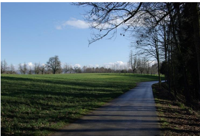
Die Flur Wüsch...