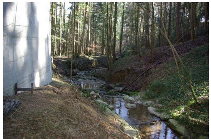
... und der Bereich des Chesselbachs, der wahrscheinlich als Wäscheplatz gedient hatte.