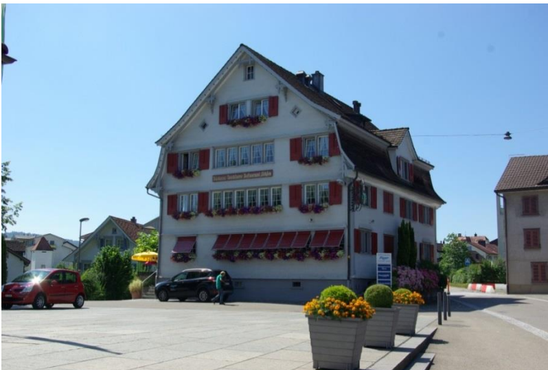
Der Ochsen heute.