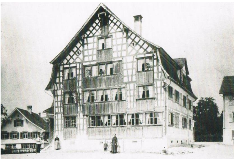
Der Ochsen auf einer alten Aufnahme.