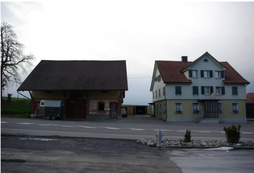
Das ehemalige Restaurant Schöntal.