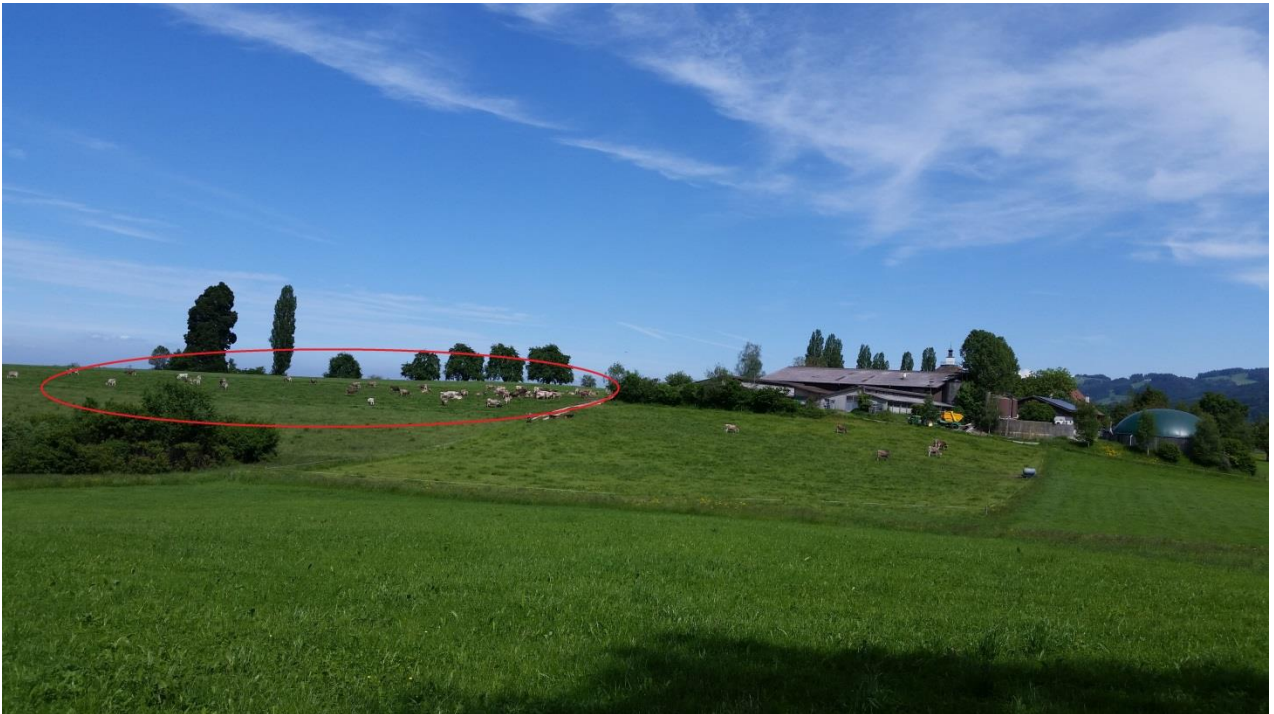
Säntisacker beim Schloss Watt