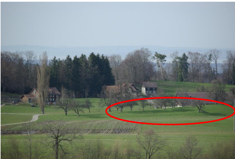
Der Büchel, dahinter Enggwil