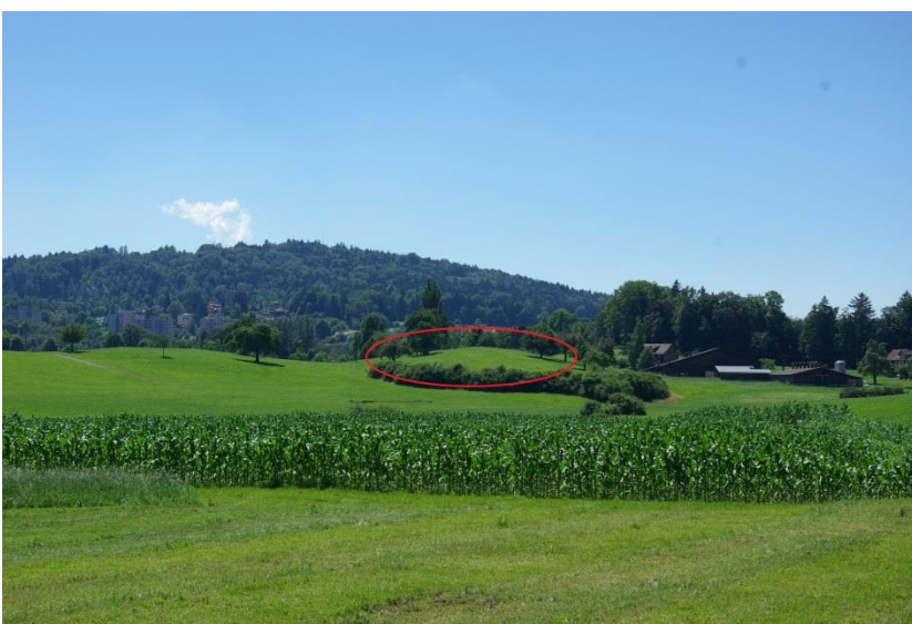
Der Büchel von Osten aus gesehen