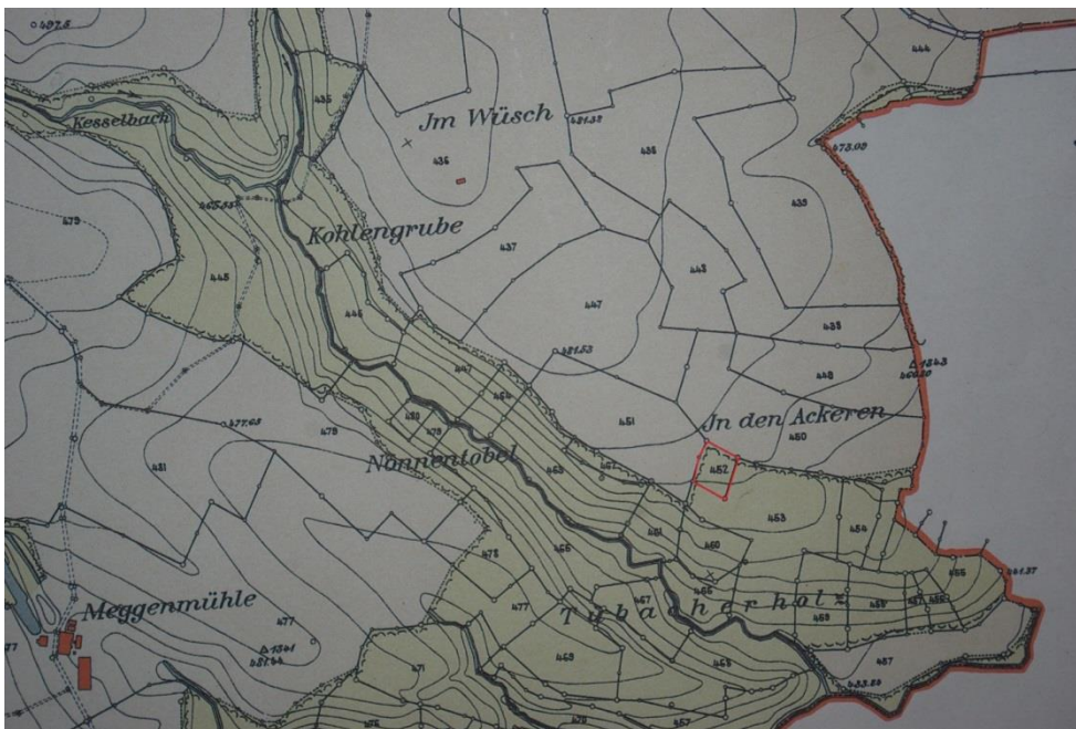
Ausschnitt aus dem Gemeindeplan von 1915: Parzelle 452