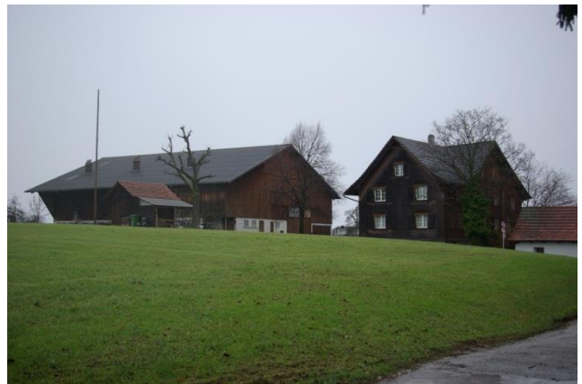
Der Hof Oberdorf.