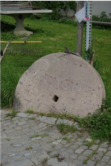
Der ehemalige Mühlstein aus dem Steinachtobel beim Hof Oberdorf.