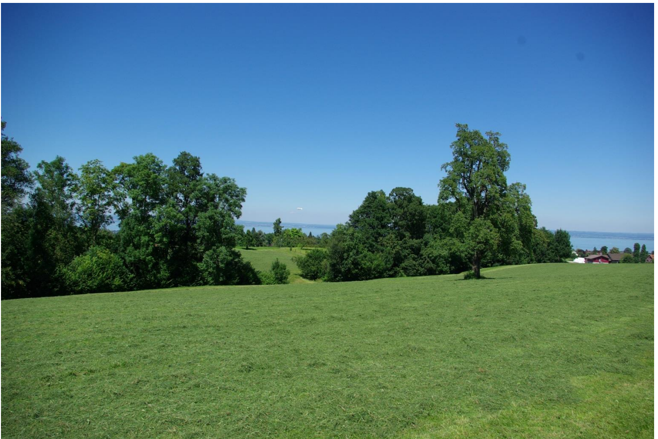
Reggenschwilerbächli (im baumbestandenem Töbeli), rechts der Hof Paradis.