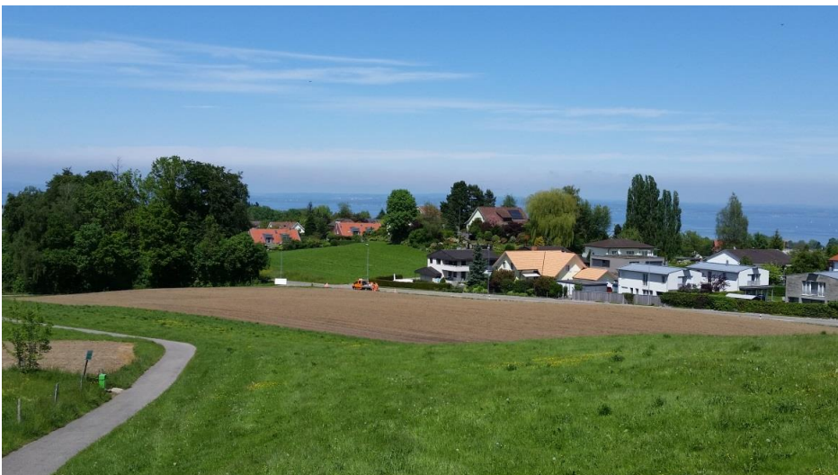
Der Hügel Schönbüel zwischen dem Quartier Untere Waid und den Häusern am Alberenberg.