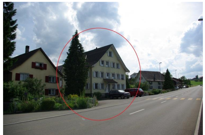
Das ehemalige Gasthaus Sonne heute.