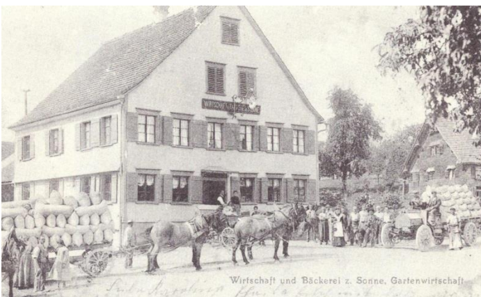
Die ehemalige Wirtschaft und Bäckerei zur Sonne auf einer alten Postkarte.