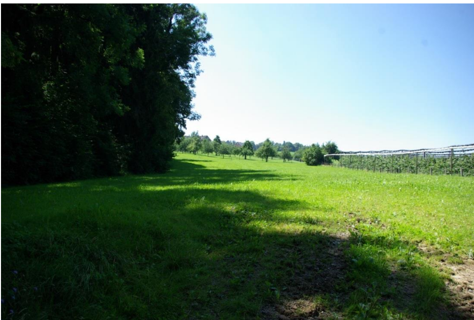
Die Wiese Müllerhölzli von Nordosten her gesehen.