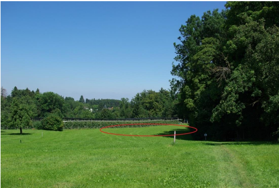
Die Wiese Müllerhölzli von Westen her gesehen.