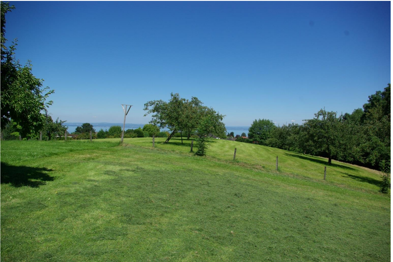
Hinter dem Zaun befindet sich die Wiese mit dem Namen Stürm.