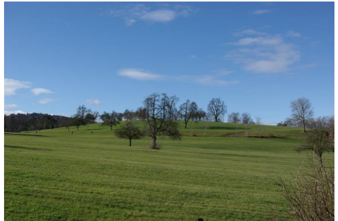
... von Osten.....