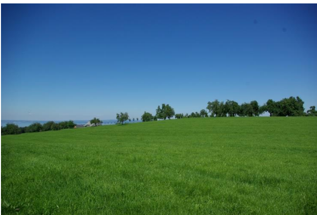
... und von Westen (im Hintergrund die ersten Giebel von Reggenschwil).