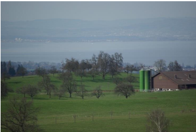
Der Vorder Langenberg von Süden....