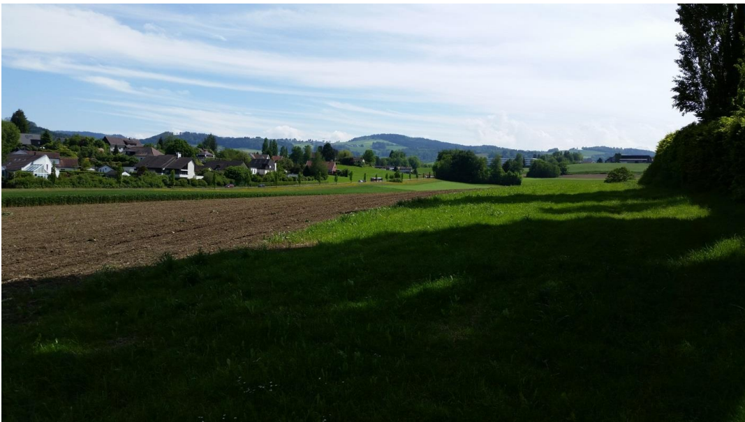
Schlossacker vom Schloss Watt aus Richtung St.Gallen fotografiert