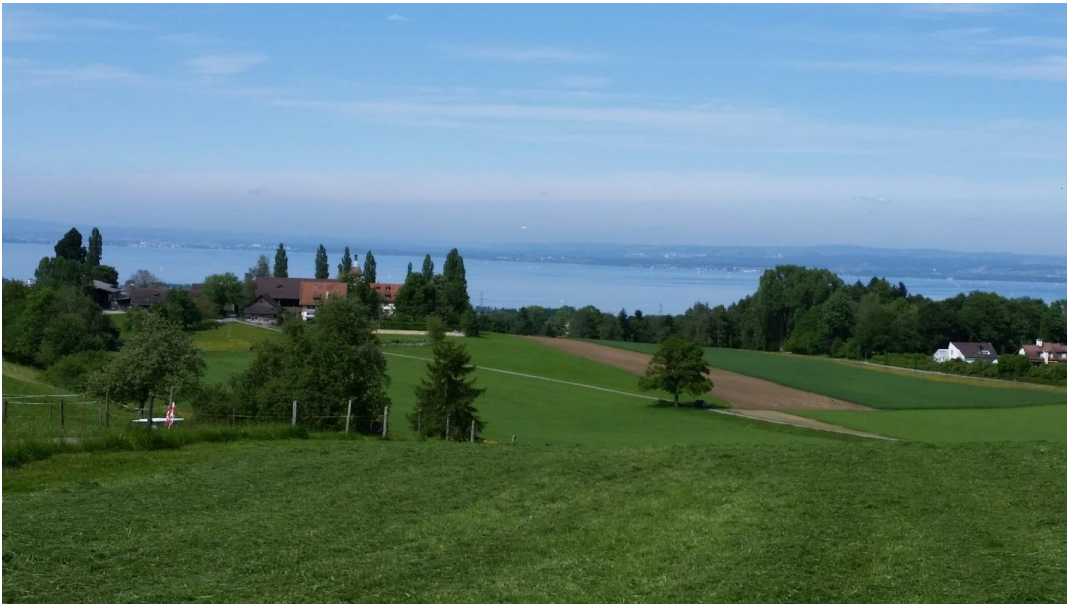
Der Schlossacker (Acker mitten im Wiesland)