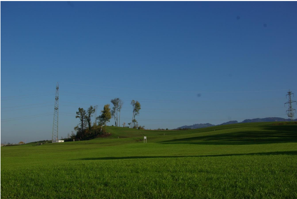
Der Boltsbüchel von der Mangelburg aus, davor die Hauptstrasse St.Gallen – Rorschach, sowie der Zubringer von Mörschwil / Näppenschwil her.