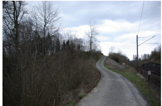
Strasse und Bahntrasse im Reggenschwiler Tobel.