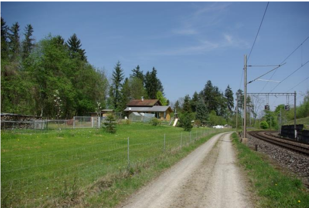
Das Bahntrasse und Bahnwärterhäuschen im Reggenschwiler Tobel.