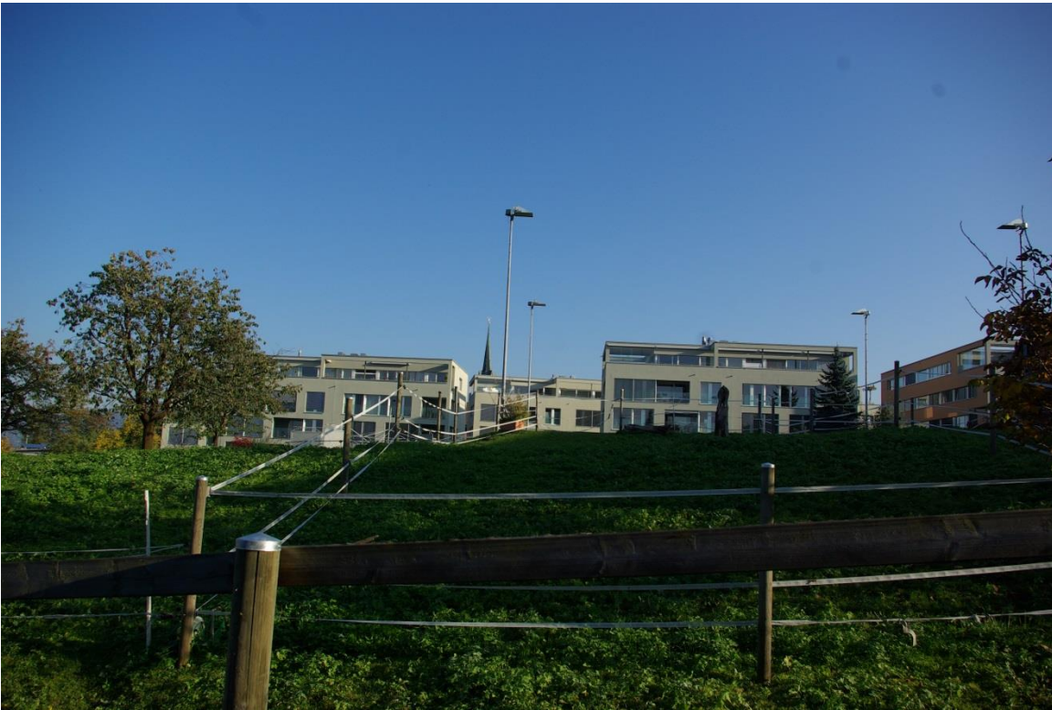
Mehrfamilienhäuser Alti Moschti, dahinter die Spitze des Kirchturms.