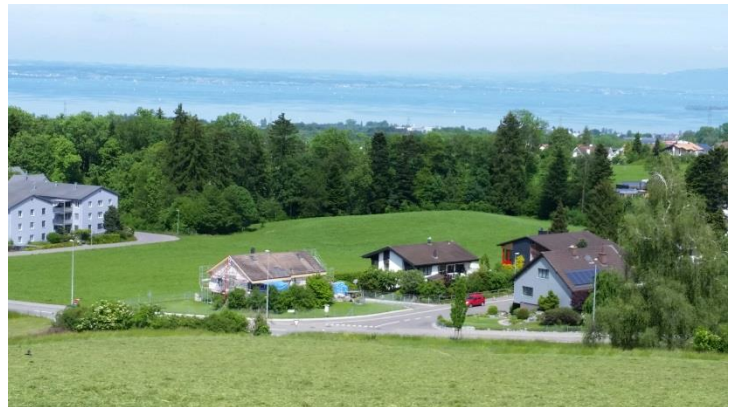
Die Waldwies liegt hinter der St.Galler Strasse rechts von der Überbauung Bachwies.