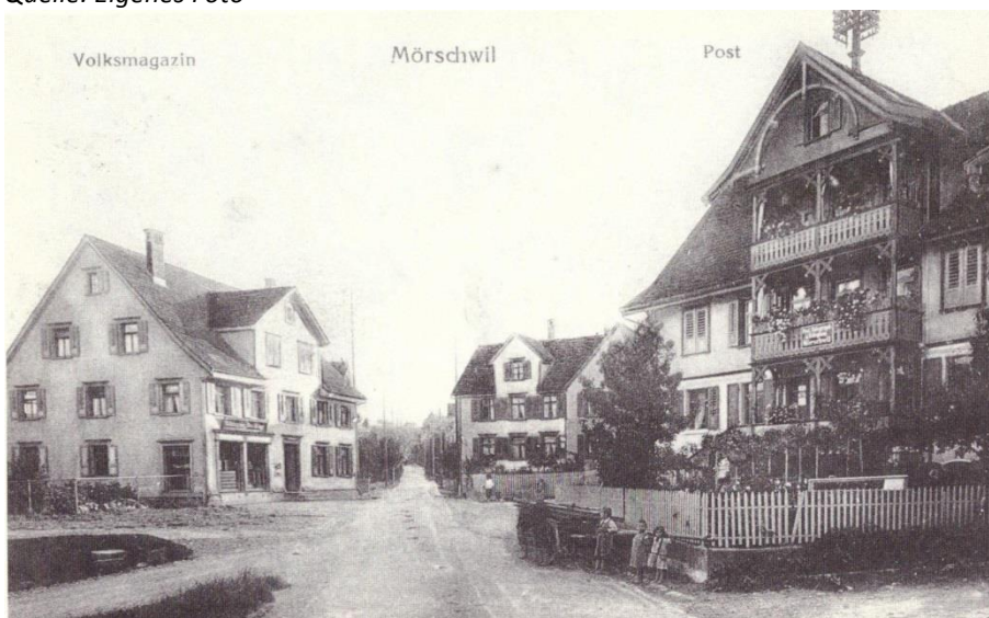
Die frühere Post auf einer alten Postkarte.