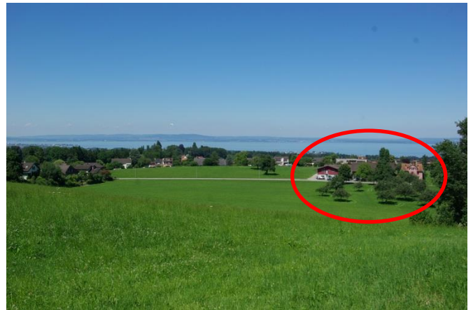
.. hier mit neu gebauter Remise.