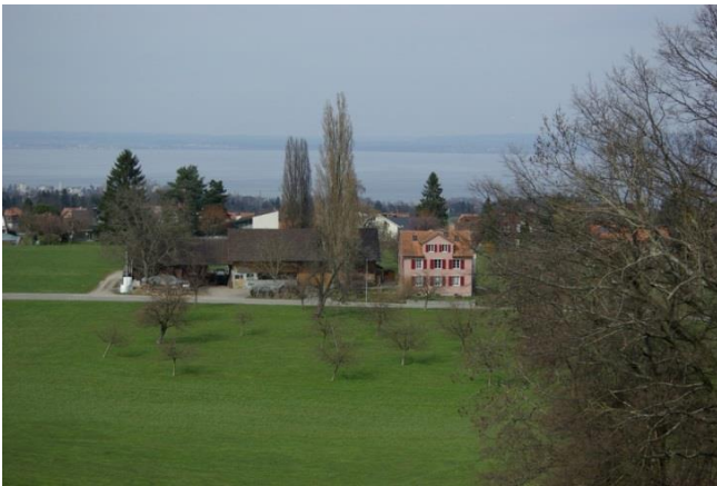
Der Hof Paradis ...