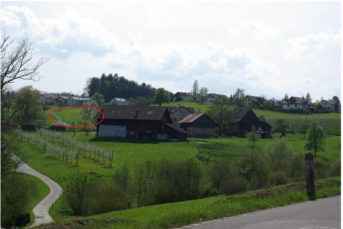
Der Bummert befindet sich auf der rechten Seite des Fahrwegs von der Farb in Richtung Betzenberg.