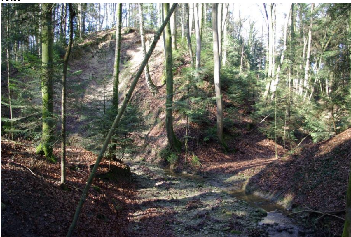
Zusammenfluss von Chesselbach (links) und Büelerbach (rechts).