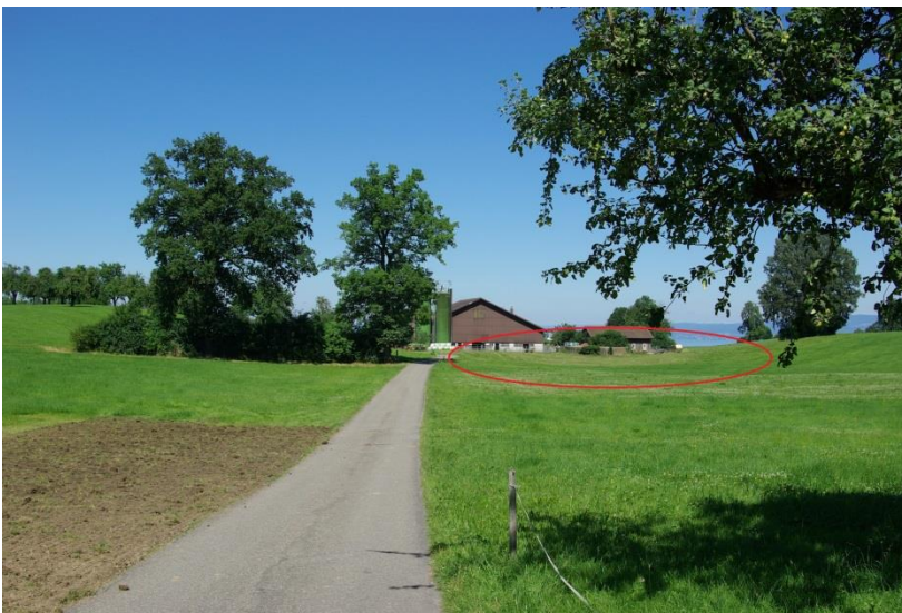
Die Haslerwies von Enggwil aus gesehen