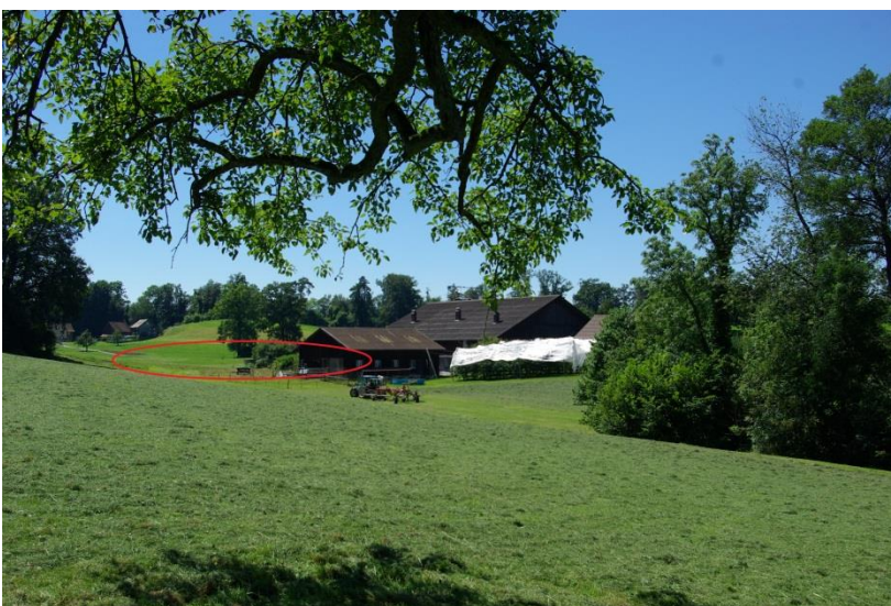
Die Haslerwies von Osten aus gesehen