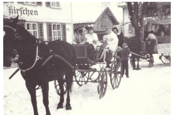
Das ehemalige Gasthaus zum Hirschen auf einer alten Postkarte (links) bzw. im Jahr 1962 (rechts).