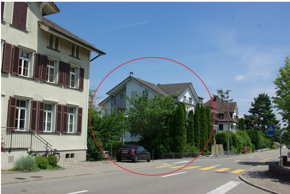
Der Standort des ehemaligen Wirtshauses Hirschen heute.