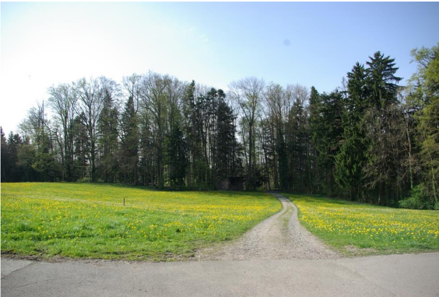
Das Mörschwiler Tobel auf der Höhe des Müllerholz.