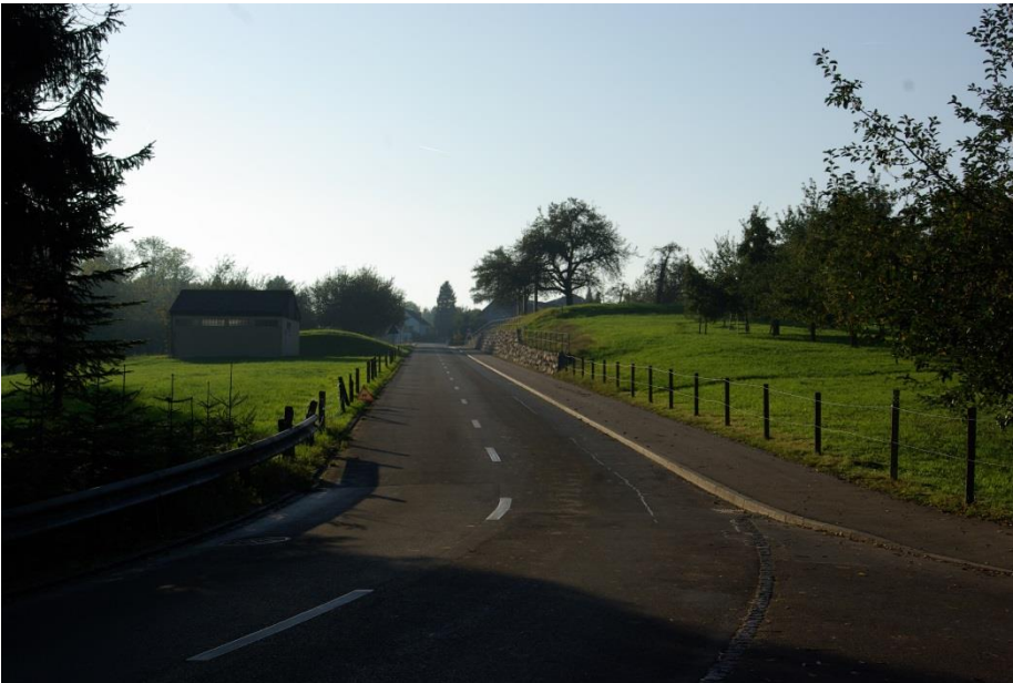
De Chübel uuf... (Quelle: Eigenes Foto).