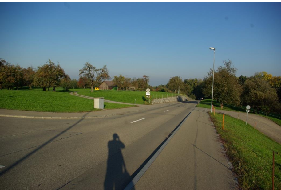
... und duraab (Quelle: Eigenes Foto).