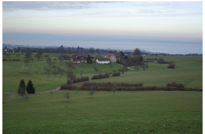
Der Weiler Lehn, dahinter das Lehnermoos