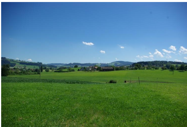
Im Lehnermoos, dahinter der Weiler Lehn