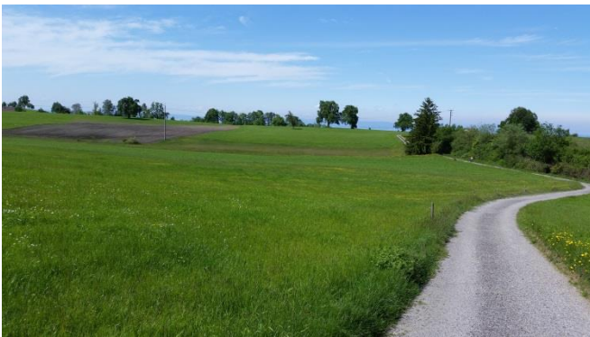
Im Lehnermoos.