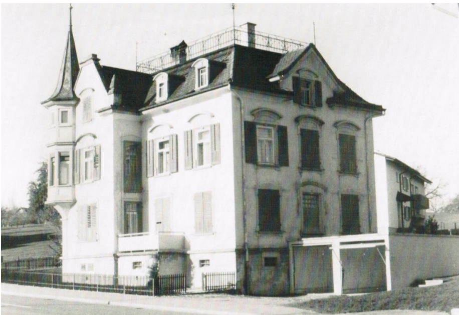
Quelle: Würth, F. (1991). Mörschwil – wie es noch ist, und wie es war.