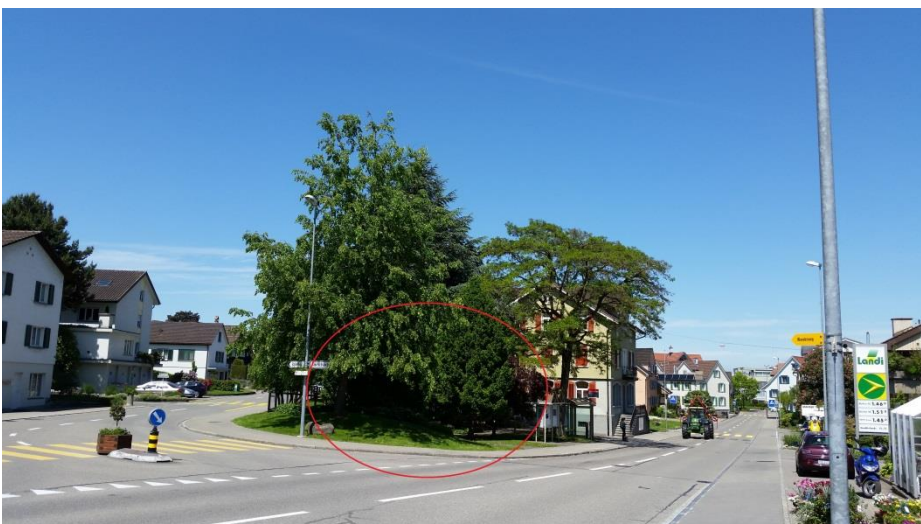
Wo das Haus Parborell einst stand...