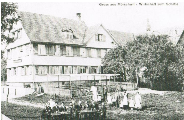
Die ehemalige Wirtschaft Schäfli im Bitzi auf einer alten Postkarte.