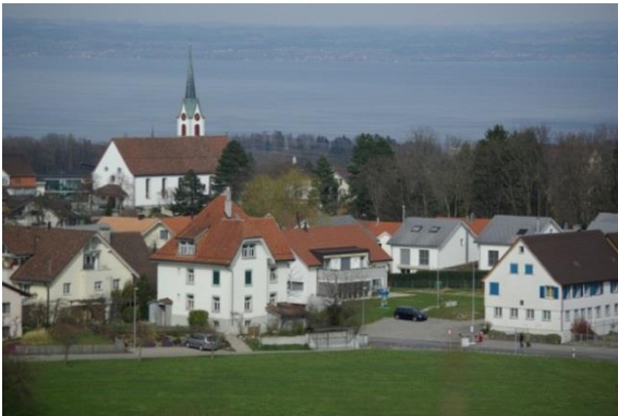
Das Gebäude des ehemaligen Restaurants Schäfli (rechts aussen) kurz vor dem Abriss.