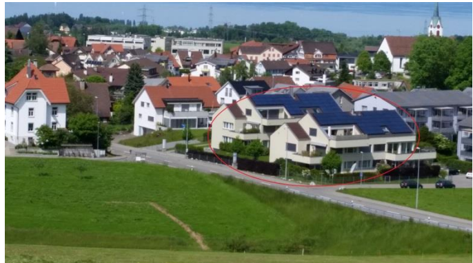
Die Situation heute (2016)