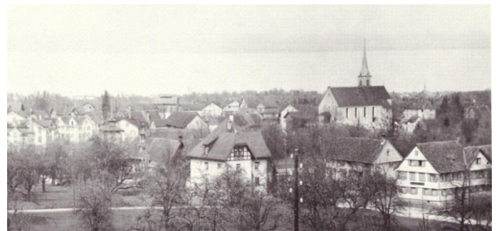
Das ehemalige Restaurant Schäfli im Bitzi (rechts im Bild).

Quelle: Würth, F. (1991). Mörschwil – wie es noch ist, und wie es war.